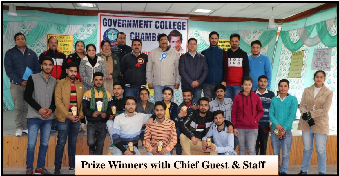
Prize Winners with Chief Guest & Staff